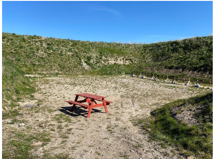
Foto over IPSC-skydeanlægget.